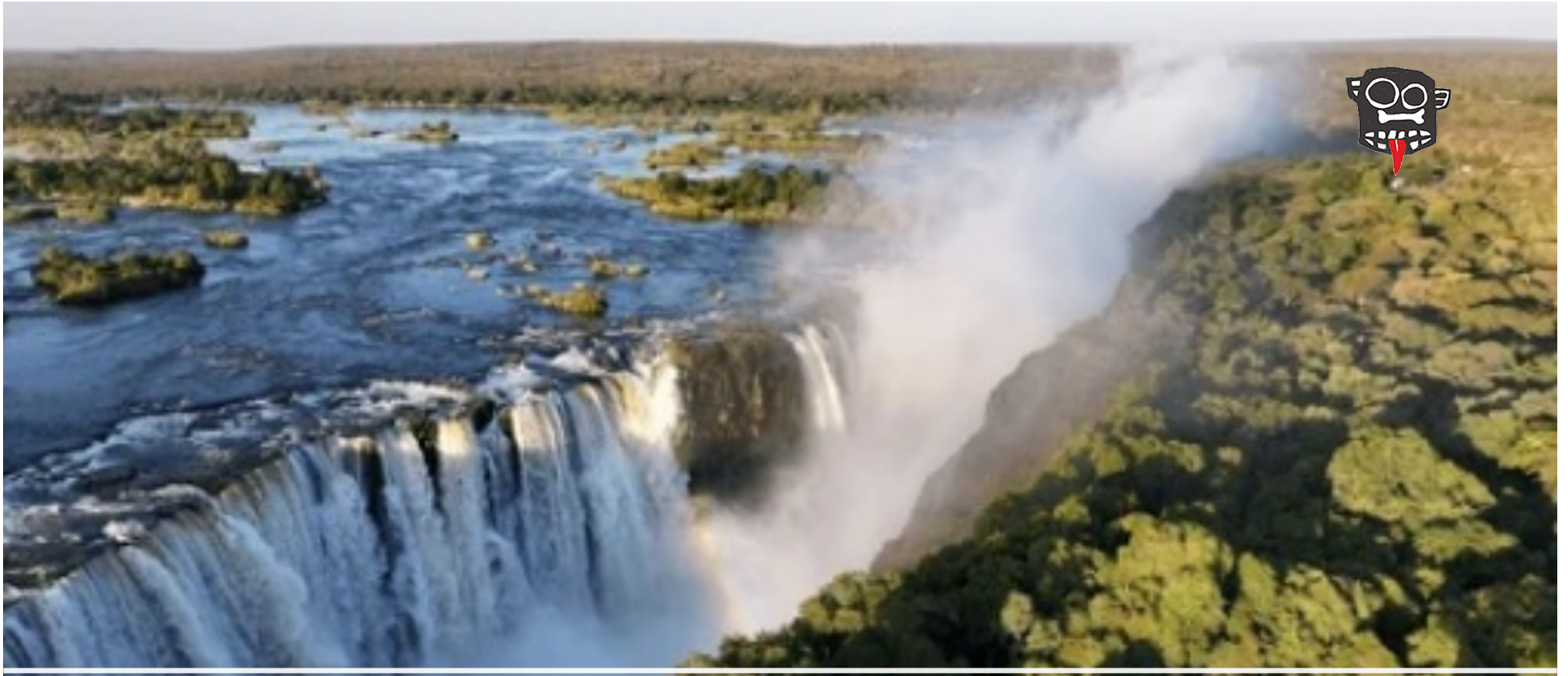
Mosi-oa-Tunya, of 'The Smoke That Thunders'